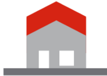
Surélévation d'une maison

Les travaux sur constructions existantes :