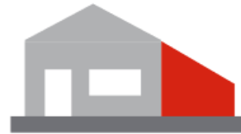
Extension d'une maison